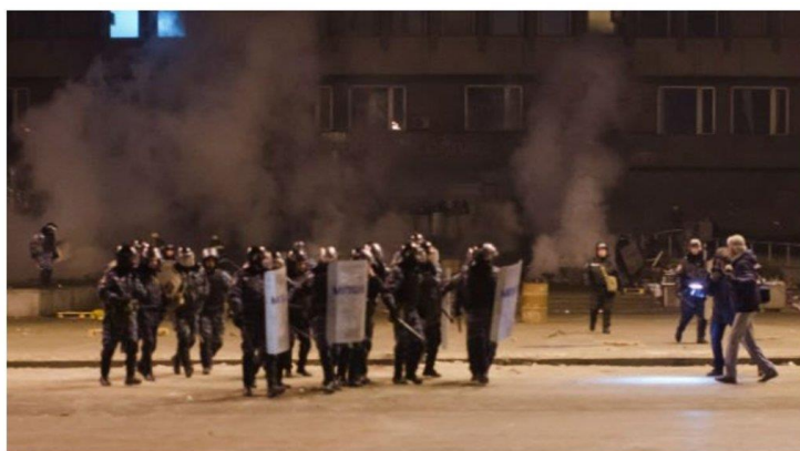
Розгін Євромайдану в Запоріжжі, 26 січня 2014 року. Фото: golos.zp [7]